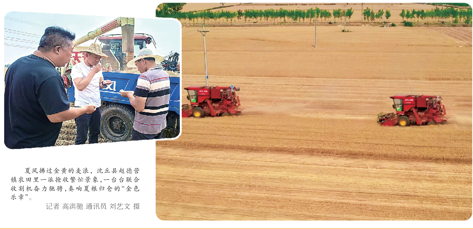
夏风拂过金黄的麦浪,沈丘县赵德营镇农田里一派抢收繁忙景象,一台台联合收割机奋力驰骋,奏响夏粮归仓的“金色乐章”。

在河南科技职业大学,刘汉瑜实地考察了实训中心、港口物流实验室、人工智能实验室等发展情况。在随后召开的座谈会上,刘汉瑜指出,科技是国家强盛之基,创新是民族进步之魂。作为教育战线的科技工作者,大家立足本职,在壮大科技力量、攻关核心技术、推动成果转化、提升全民素养等方面作出了重要贡献,为周口市乃至河南省的产业转型升级提供了有力支撑。希望广大教育科技工作者在立德树人、产业发展、校企合作等方面取得更多建树,在教书育人中传承科学精神,在科研实践中践行创新使命,积极营造崇尚科学、尊重创新的良好氛围。①6